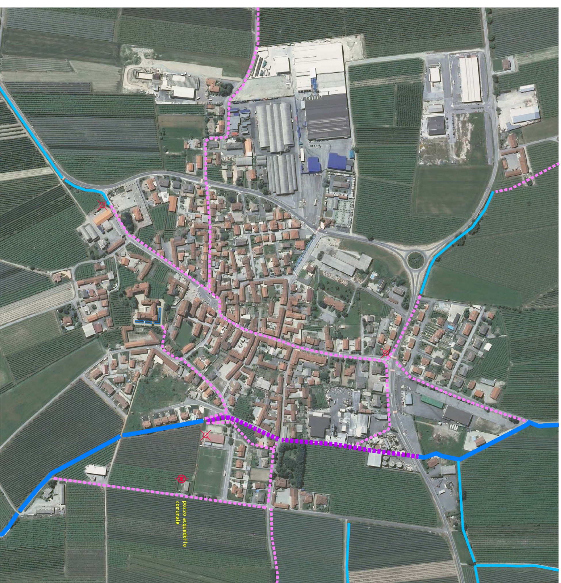
Reti delle concidazioni attraversanti il concentrico di Lagnasco - scala 1:5.000